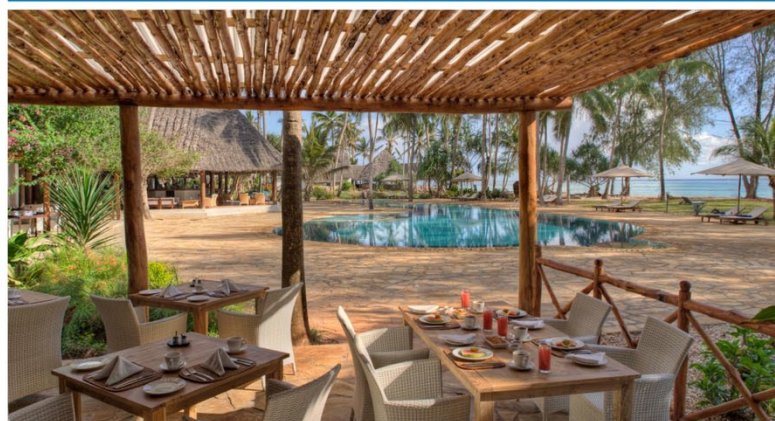
Le restaurant Makuti propose des espaces repas en intérieur et en extérieur.