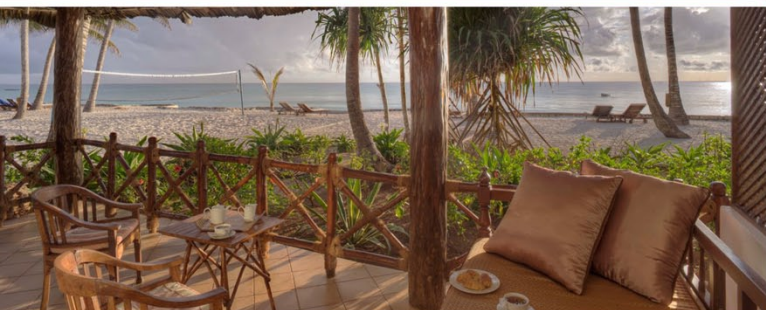
Les chambres "Bahari" disposent d'une grande terrasse à quelques mètres de l'océan Indien

Le Sultan Sands Island Resort affiche un total de 76 chambres dont l'architecture n'est pas sans rappeler les cases circulaires traditionnelles d'Afrique. Les chambres (2 par case) sont spacieuses, lumineuses et soigneusement décorées dans le style Swahili traditionnel. Elles disposent d'un dressing séparé, d'une salle de bains attenante et d'une terrasse ou d'un balcon.