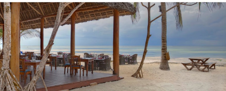
Le bar et restaurant Kivuli pour un diner relax, les doigts de pied en éventail dans le sable