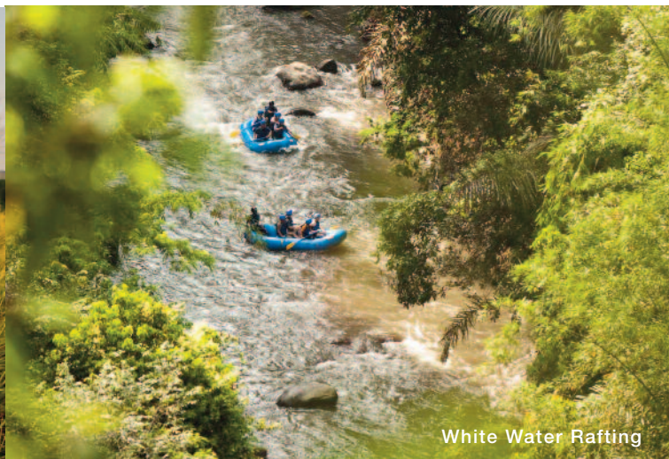
White Water Rafting