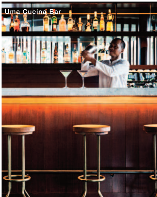
Uma Cucina Bar