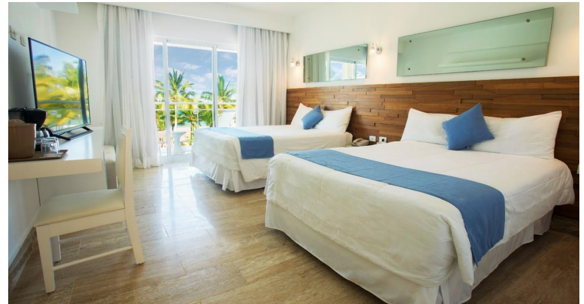
Supérieure vue sur le mer