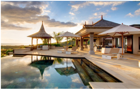
HERITAGE THE VILLAS